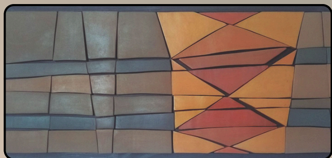
Oeste con Atuel, cerámica placa - gres coloreado - engobe y bruido Jorge Enrique Woychejoski

Pensar los procesos de enseñanza y de aprendizaje insulares del Delta en pos de ejercer el derecho a la educación a lo largo de la vida para toda la población.