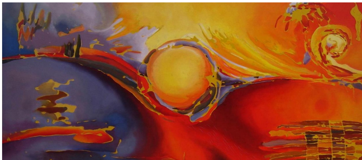
Sol Naciente, óleo sobre tela. Jimena Cabello

Este artículo puede aportar doblemente a ello: por un lado, ofrece al diseño curricular y didáctico los criterios pedagógicos desarrollados en las páginas previas; por otro lado, brinda una guía metodológica para la investigación, al especificar los ejes de análisis que permiten caracterizar los cursos o talleres de lectura y escritura académicas en vistas a acortar la distancia entre enseñanza y aprendizaje: 1) quiénes y cómo son los alumnos que participan, 2) cuál es la naturaleza de lo que se quiere enseñar, y 3) de qué modo la enseñanza se ajusta a las necesidades de los alumnos y resguarda la naturaleza del objeto de enseñanza.