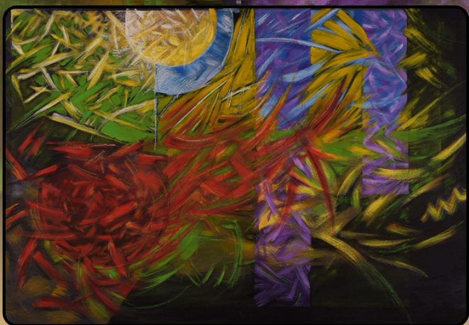
"Ferma x Gaggero", óleo_sobre_bastidor_de_fibrofácil. Gustavo Gaggero