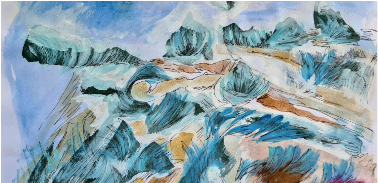
Paisaje, acrílico y tinta sobre papel. Ana Maria Martin

A días del inicio del ciclo lectivo 2024, imagino mi clase inaugural. Iré con mis estudiantes al parque cercano a la universidad, nos sentaremos a dialogar y dibujar junto al añoso ombú. Nos fundiremos con sus enormes raíces y todo fluirá sin violencia.