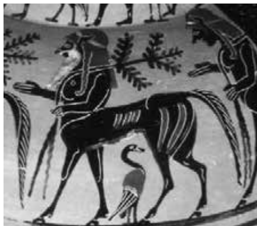
Centaurio en un vaso griego

La imagen que seleccionaron los griegos para representar al maestro es muy diferente: el maestro griego por excelencia es el centauro Quirón. Un centauro, criatura mitad hombre mitad caballo. La racionalidad expresada en lo humano se complementa con la pasión y el vigor atribuida a su parte animal.