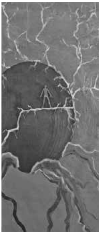
Detalle obra "¿Identidad?" Ricardo Arcuri