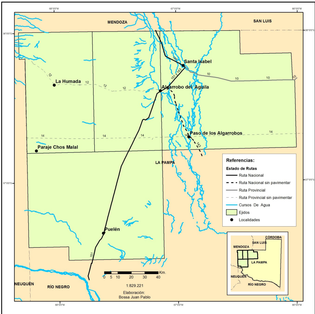
Figura 1. Ubicación de Chos Malal en el extremo oeste pampeano