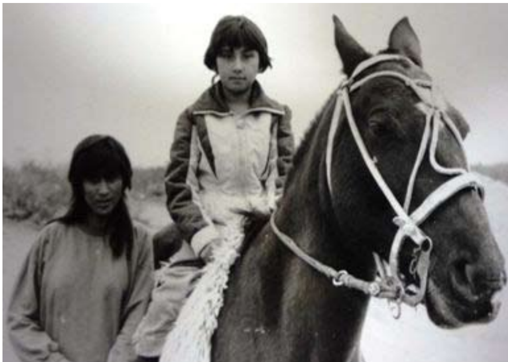
Figura 4. Niñas del paraje Chos Malal yendo a la escuela.