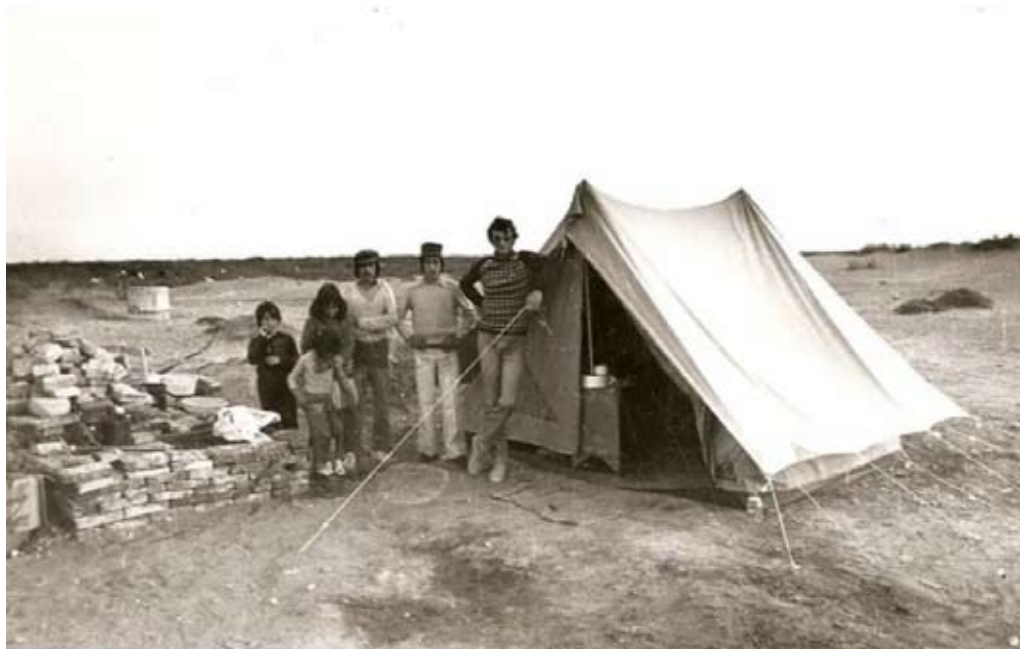
Figura 3. Maestro acampando en Chos Malal al lado de la vieja escuela.