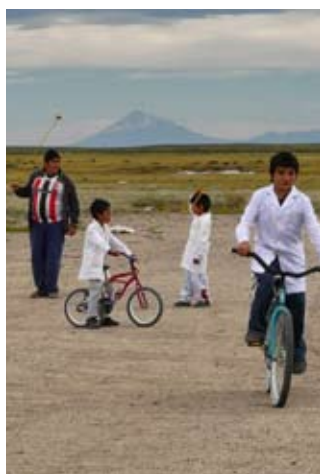
detalle Recreo en la escuela de Chos Malal , fotografía. Eugenia Comerci.