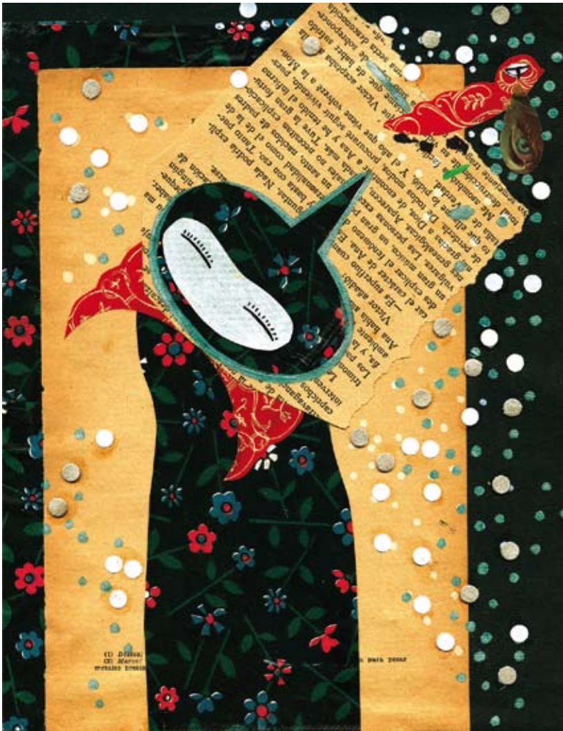
Sin título, ilustración digital. Mariela González

Fecha de Aceptación: 9 de agosto de 2015