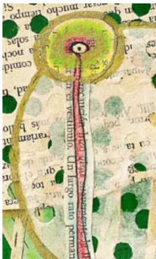
Detalle “Cabeza verde”, ilustración digital. Mariela González