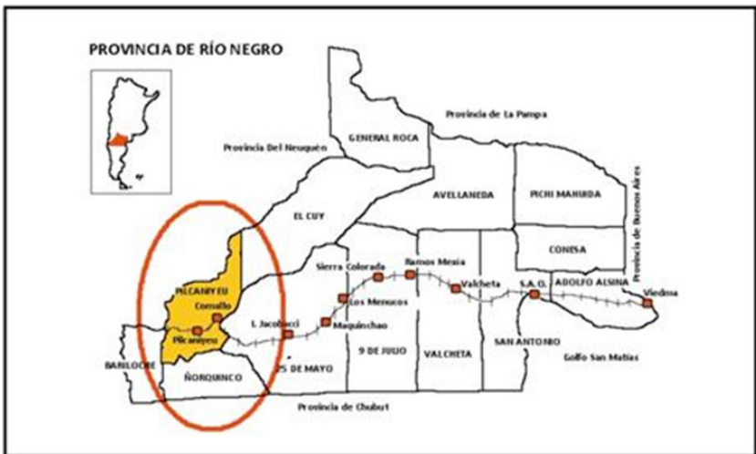
Figura 3. Localización del pueblo de Pilcaniyeu.