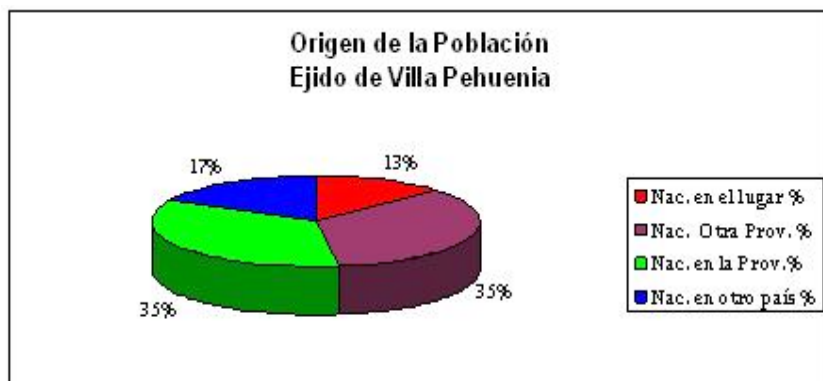
Figura 2. Origen de la población de Pehuenia.