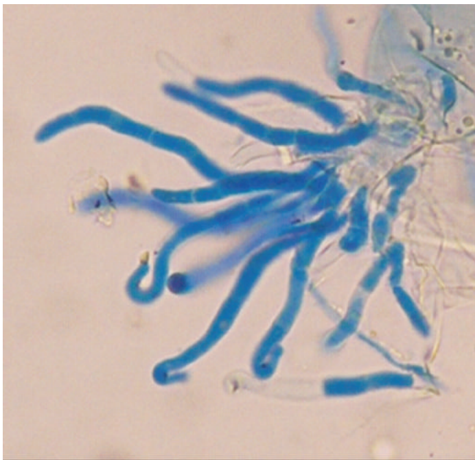
Foto 2. Ramularia collo-cygni : fascículo de conidióforos desarrollado sobre hoja de cebada. Photo 2. Fascicle of Ramularia collo-cygni conidiophores developed on barley leaf.