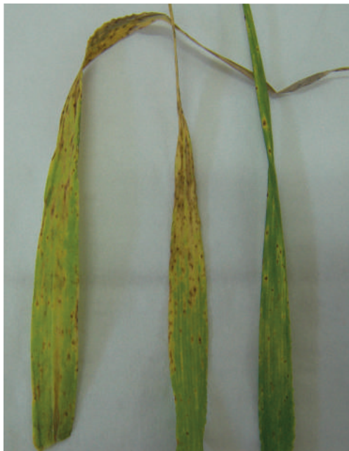
Foto 1. Hojas de cebada con síntomas del salpicado necrótico.