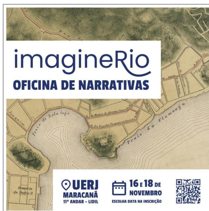
Figura 2. Imagem de divulgação das oficinas

O projeto piloto nasce do interesse em pensar a utilização da ferramenta Narrativas do imagineRio como metodologia de ensino-aprendizagem aplicada na docência no Rio de Janeiro. Para tal, foram estabelecidos como objetivos, primeiramente, apresentar a ferramenta das Narrativas para docentes da cidade, através da oferta de oficinas, a fim de promover a sua utilização em práticas pedagógicas, tanto na educação básica como no ensino superior. Ainda, num segundo momento, o projeto estabeleceu como meta, após retorno de participantes das oficinas, contribuir para aprimoramentos na ferramenta e analisar suas potencialidades de aplicação no ensino (Figura 2).