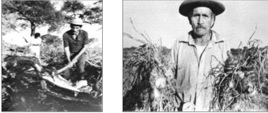
Imagen 4. Corte de quebracho (izquierda) y cosecha de cebollas o "cash crop" (derecha)