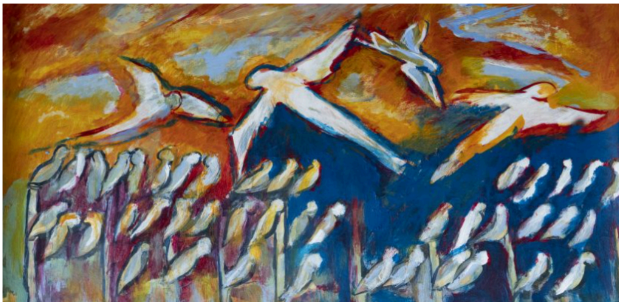
Comunidad , acrílico sobre papel. Ana María Martín

De tal modo, buscamos haber posibilitado y potenciado la necesidad de ontologizar a la investigación educativa y a nuestras pedagogías habitándolas desde nuestros territorios situados y relacionados, como vínculos del humus de una humanidad que reconoce diversas rutas posibles e “inéditos viables”, en articulación con procesos de formación, a partir de las ideas de comunalidad, horizontalidad y humus -Tierra de humanidad como sentidos de las prácticas descolonizadoras, que hemos sustentado en el trayecto argumentativo de este texto.