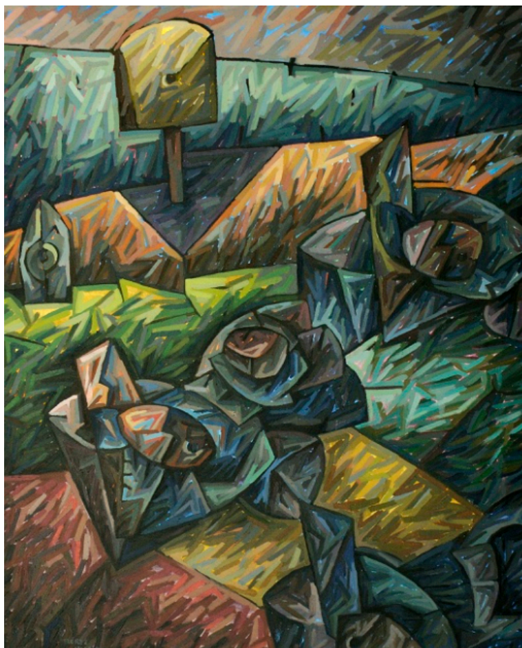
Procesión, pintura –acrilico. José Flores Nale