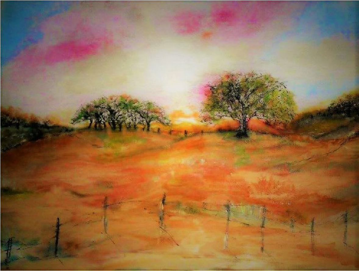
Luz de otoño en el medanal , técnica mixta. Adriana Chavarri