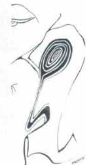
Detalle obra "Aburrída" Gríselda Carassay.

Key words: Training- teaching- political action