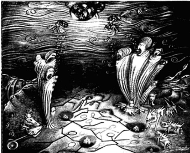
“Atrapado en el sueño de una mosca”, dibujo Damián Watson

a los lugares de maltrato y humillación. La secuencia de acciones desarrollada por M, al encontrar a los niños bajo penitencia en la clase de plástica, muestra una respuesta distinta de la sumisión al código de comportamiento escolar. Esta respuesta recurre además a las pautas de “no daño”, fundamento de la ternura (Ulloa, 1995), y preserva la tarea. Es decir que, a través suyo, se garantiza la continuidad del buen trato de GN y se cuida la tarea primaria, que no es abandonada sino retomada en un espacio protegido.