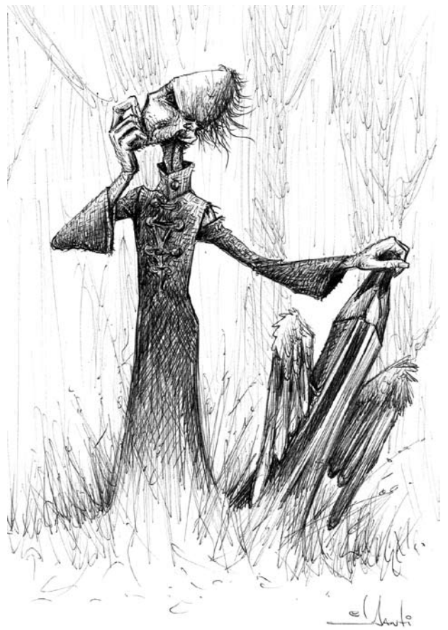
"El lápiz voladito", dibujo El Santi Rodríguez

La investigación doctoral en curso, define su tema como el de la relación entre espacios educativos alternativos (EEA) –a los encuadres escolares convencionales y dentro de la educación formal– y el aprendizaje de niños calificados en el sistema educativo como "fracasados escolares" . Se trata de pensar el modo en que el cambio en la configuración del espacio institucional preparado para el aprendizaje incide en la gene-