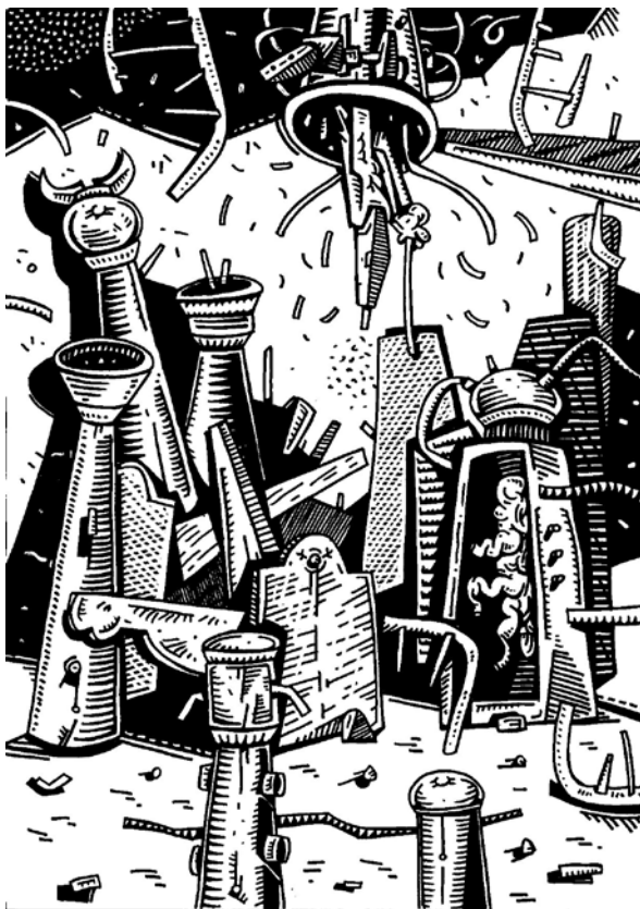
“Mediador”, tinta José Flórez Nale

Para avanzar en el conocimiento de este complejo campo, es preciso abordar los fenómenos objeto de interés a través del estudio de su relación con las condiciones y dinámica institucionales (Fernández, 1993).