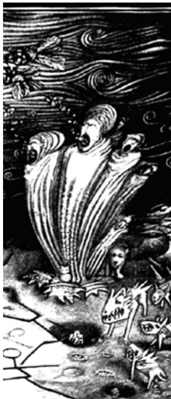
Detalle obra “Atrapado en el sueño de una mosca”, Damián Watson