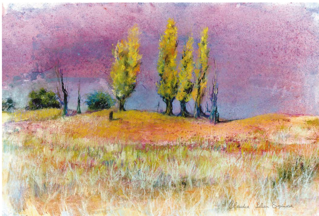
"Olivillos del medanal", mix technique. Claudia Espinosa

Received: January 25th, 2018 First Reviewed: February 27th, 2018 Second Reviewed: March 3rd, 2018 Accepted: March 3rd, 2018