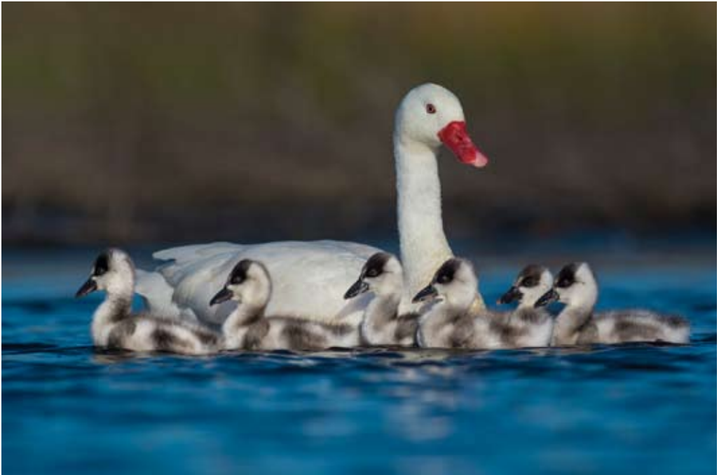
S/T, fotografía. Gabriel Rojo

La información empírica proviene de la revisión de documentos (Curriculum vitae y