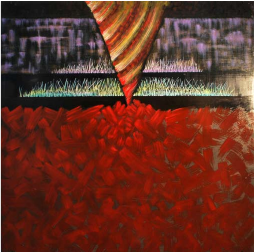
"Lecho ardiente", óleo. Gustavo Gaggero