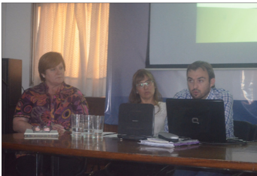
Panel Guerra en Siria. La trama geopolítica regional y sus consecuencias en la población civil.

XX, y luego de la caída del Imperio Otomano, las potencias europeas, en este caso Francia y Reino Unido, rediseñaron las fronteras territoriales en distintas esferas de influencia hasta el momento de las independencias nacionales. En el presente, los antagonismos entre los liderazgos regionales se manifiestan también en el conflicto sirio. Arabia Saudita, Irán y Turquía son actores fundamentales que defienden sus intereses particulares a expensas de la situación en Siria e Irak. De igual modo, el tablero geopolítico regional cuenta con la participación de una coalición entre Estados Unidos y algunos países europeos, más las intervenciones de la Federación Rusa en su intento de reposicionarse como potencia de alcance global y mantener sus pretensiones geoestratégicas en la costa mediterránea. Asimismo, no debe soslayarse la participación de grupos kurdos que, diseminados por los países de la región, intentan recuperar en la actual coyuntura la autonomía de sus territorios ancestrales.