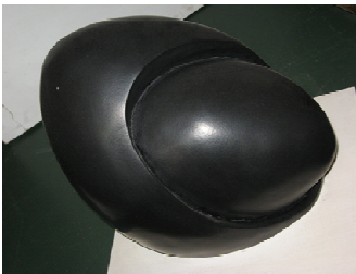
Título: SERIE PARA NO VIDENTES 7 Técnica y materiales: PLÁSTICO REFORSADO Medidas: 0,33 X 0,24 X 0,29 cm.

Sus esculturas son acromáticas patinadas algunas en negro y otras en blanco, con una tendencia a generar superficies más brillantes que opacas. En una de sus muestras César Magrini expresa: "Sus piezas atraen como un hechizo. Sólo el blanco y el negro son sus colores; la fantasía del artista se derrama, abundantemente, en las formas, que no encuadran dentro de lo habitual, pero que si tienen, en cambio, una hermosura propia y segura" (Magrini, 1987:3).